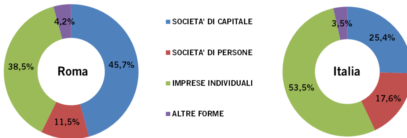
Graf. 2 – Incidenza percentuale delle imprese registrate per forma giuridica al 31 dicembre 2015